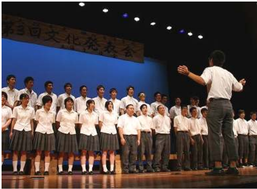
クラス一一致団結して、日頃の練習の成果をいかに発揮！

実行委員長コメント 全校生徒で取り組んだことで、柳川高校に新しい息吹を感じました。場内が拍手喝采となり、みんなが活き活きとして取り組む姿を見たときに、文化発表会を開催して本当に良かったと心から思いました。この自主性をよき伝統として、後輩たちにバトンタッチしたいと思います。